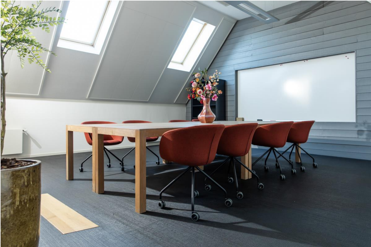
Vergaderzaal op de verdieping