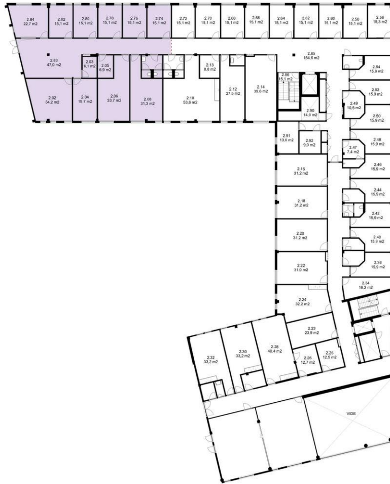
2e Verdieping Den Elterweg 75 Zutphen