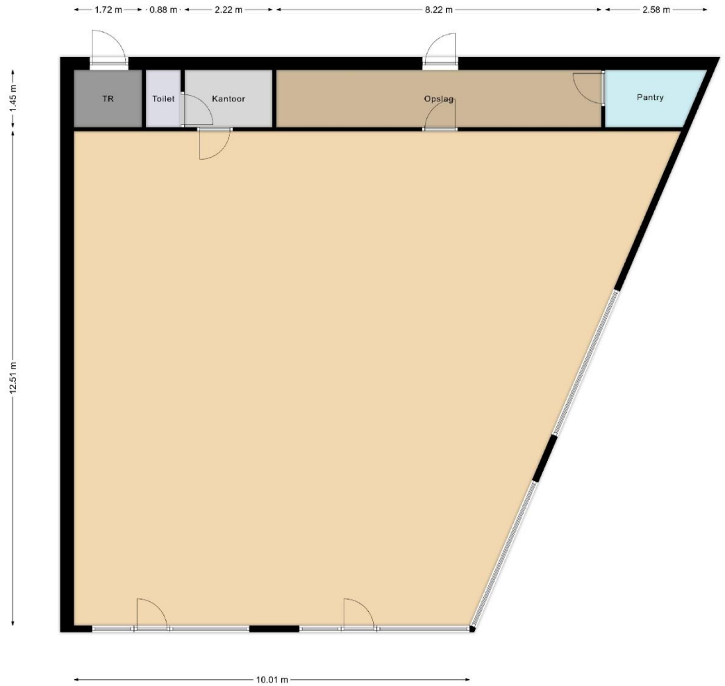
Ina Boudier-Bakkerstraat 3 te Leiden - Begane grond Indeling/maatvoering kan afwijken