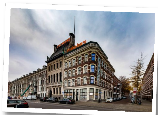
Maaskade 113, 3071 NJ Rotterdam

Informatie aanvragen of bezichtiging plannen? Bel: 010 - 424 8 888