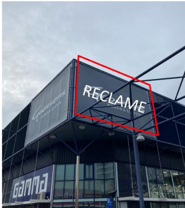
Positie 3 – buitenkant B