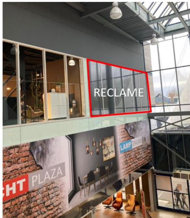
Positie 1 – entree