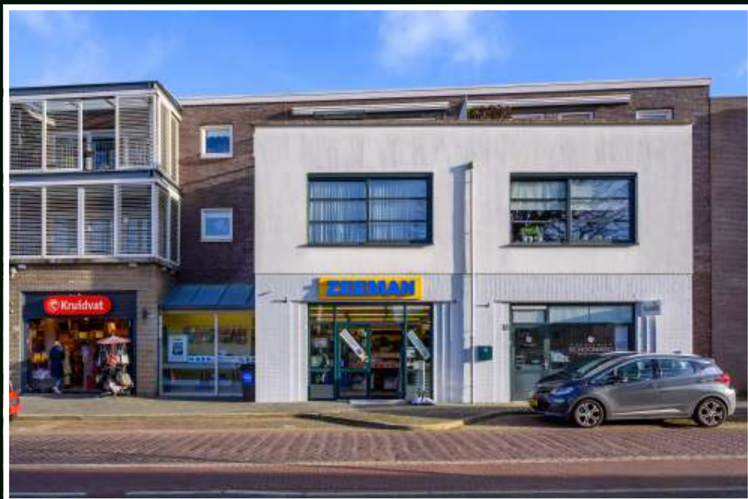
Brummen Ambachtstraat 18a