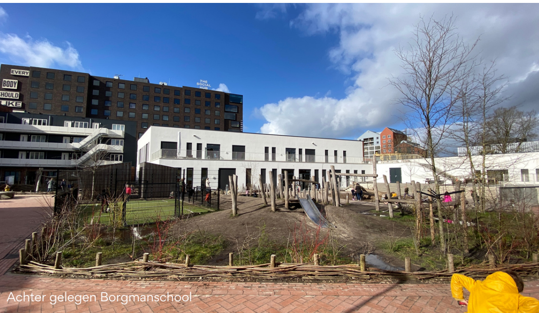
Achter gelegen Borgmanschool