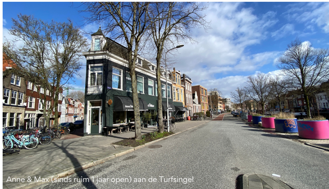
Anne & Max (sinds ruim 1 jaar open) aan de Turfsingel