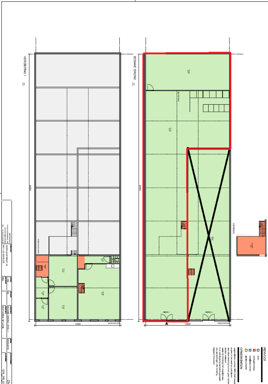
Begane Grond en 1 ste verdieping