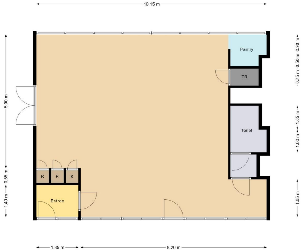
Godfried Bomansstraat 26 te Leiderdorp Begane grond Indeling/maatvoering kan afwijken