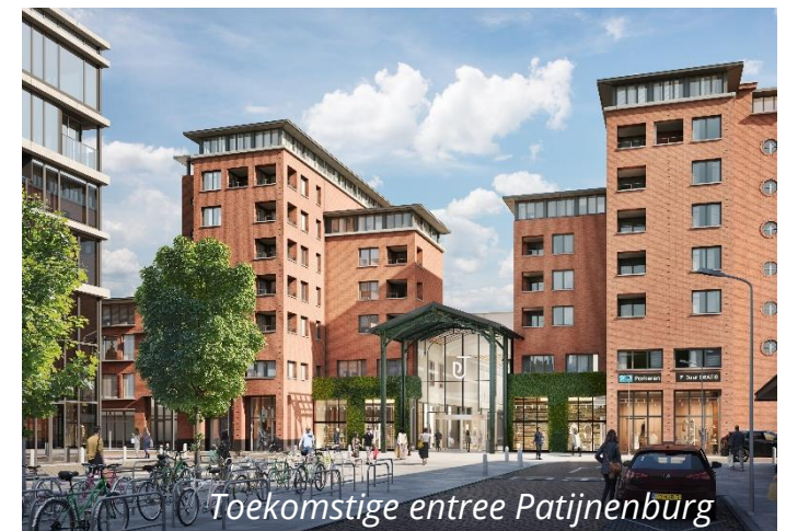
Toekomstige entree Patijnenburg