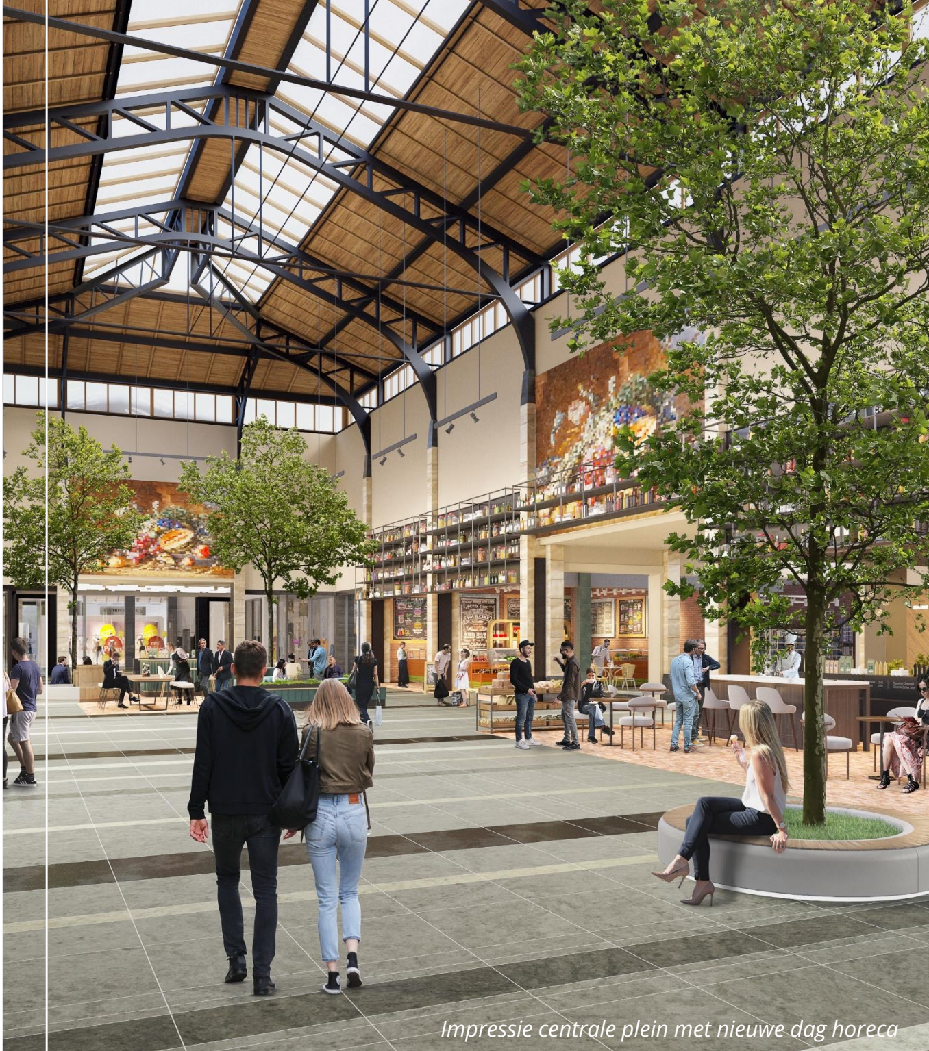
Impressie centrale plein met nieuwe dag horeca