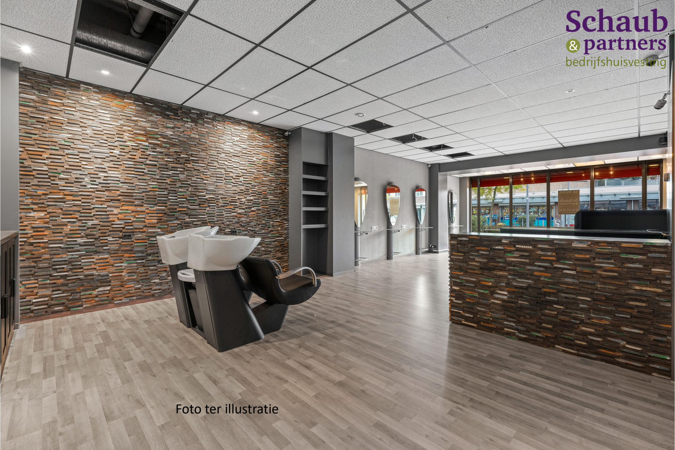
Foto ter illustratie