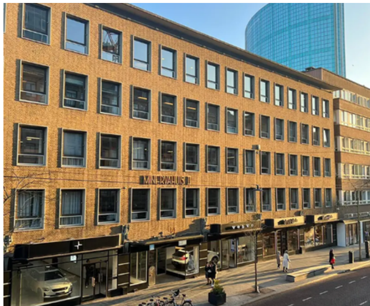
Meent 106 te Rotterdam

Bezichtiging inplannen? ☎ 010-8411712 ✉ verhuur@lexenco.nl