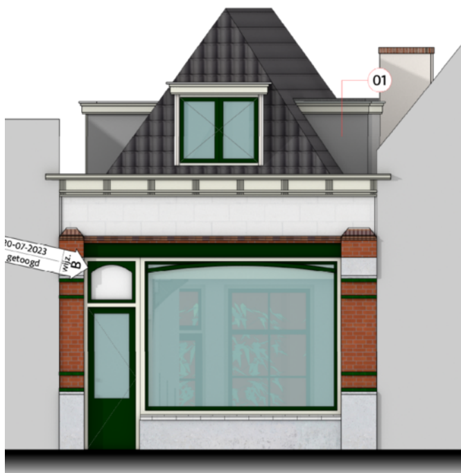
Voorgevel - NIEUW wijzigingen voorgevel: kleuren houtwerk aanpassen

revisie C 20-07-2023 opdracht: projectcode: projectadres: onderwerp: schaal: