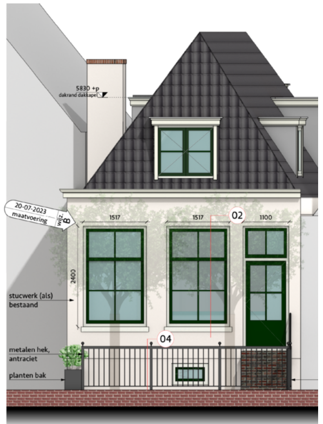
Achtergevel - NIEUW