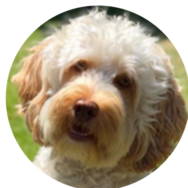
Maurice de hond