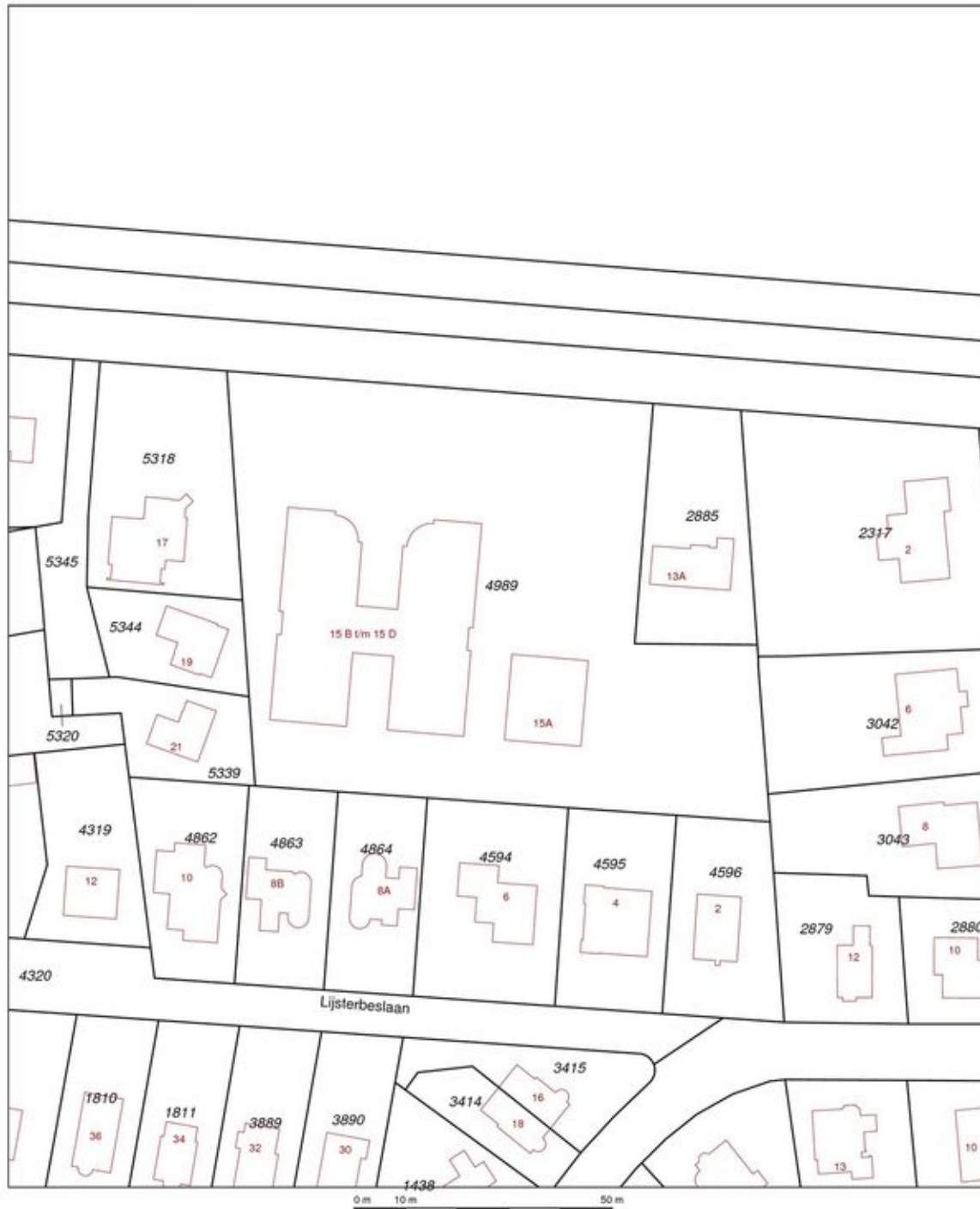
Uittreksel Kadastrale Kaart