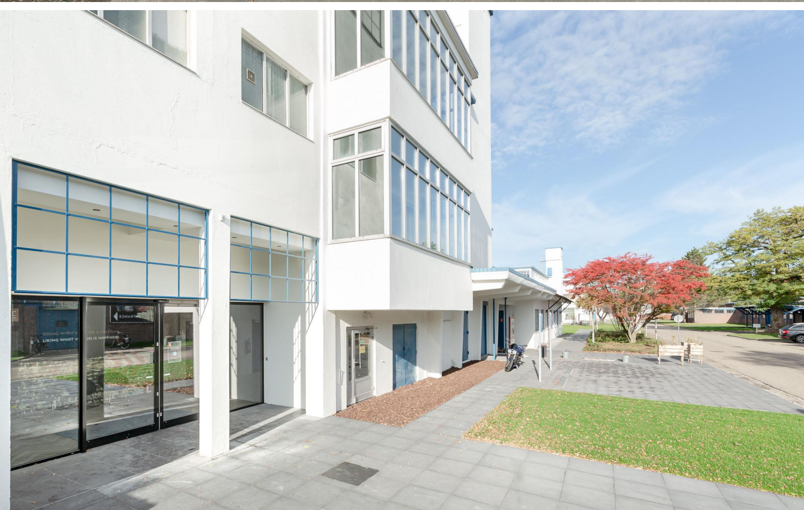
C'park Bata Europaplein 1 te Best