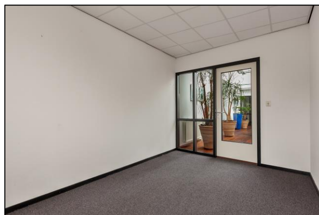
Kantoor 2 beschikbaar per 1-04-2025