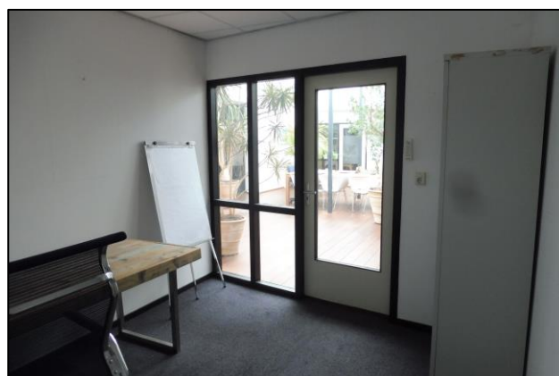
Kantoor 6 beschikbaar per direct