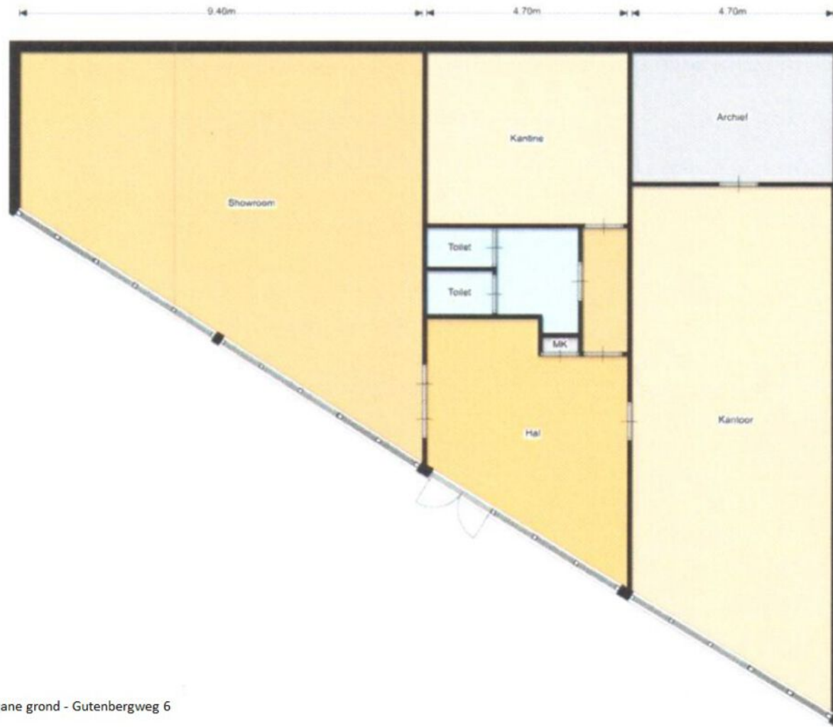
Begane grond - Gutenbergweg 6