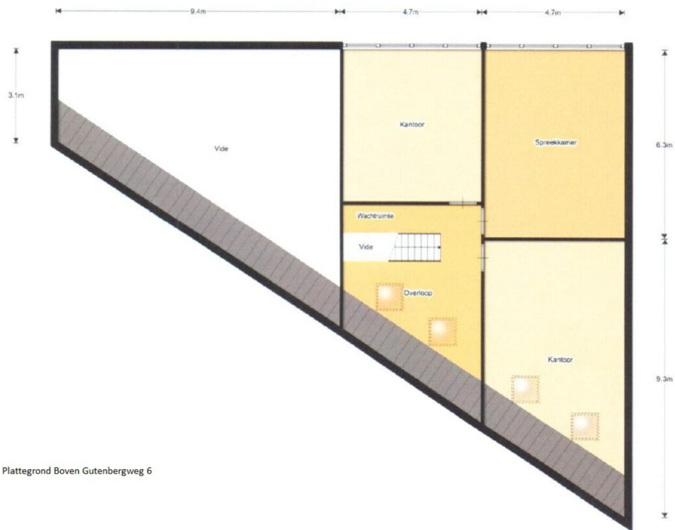
Plattegrond Boven Gutenbergweg 6