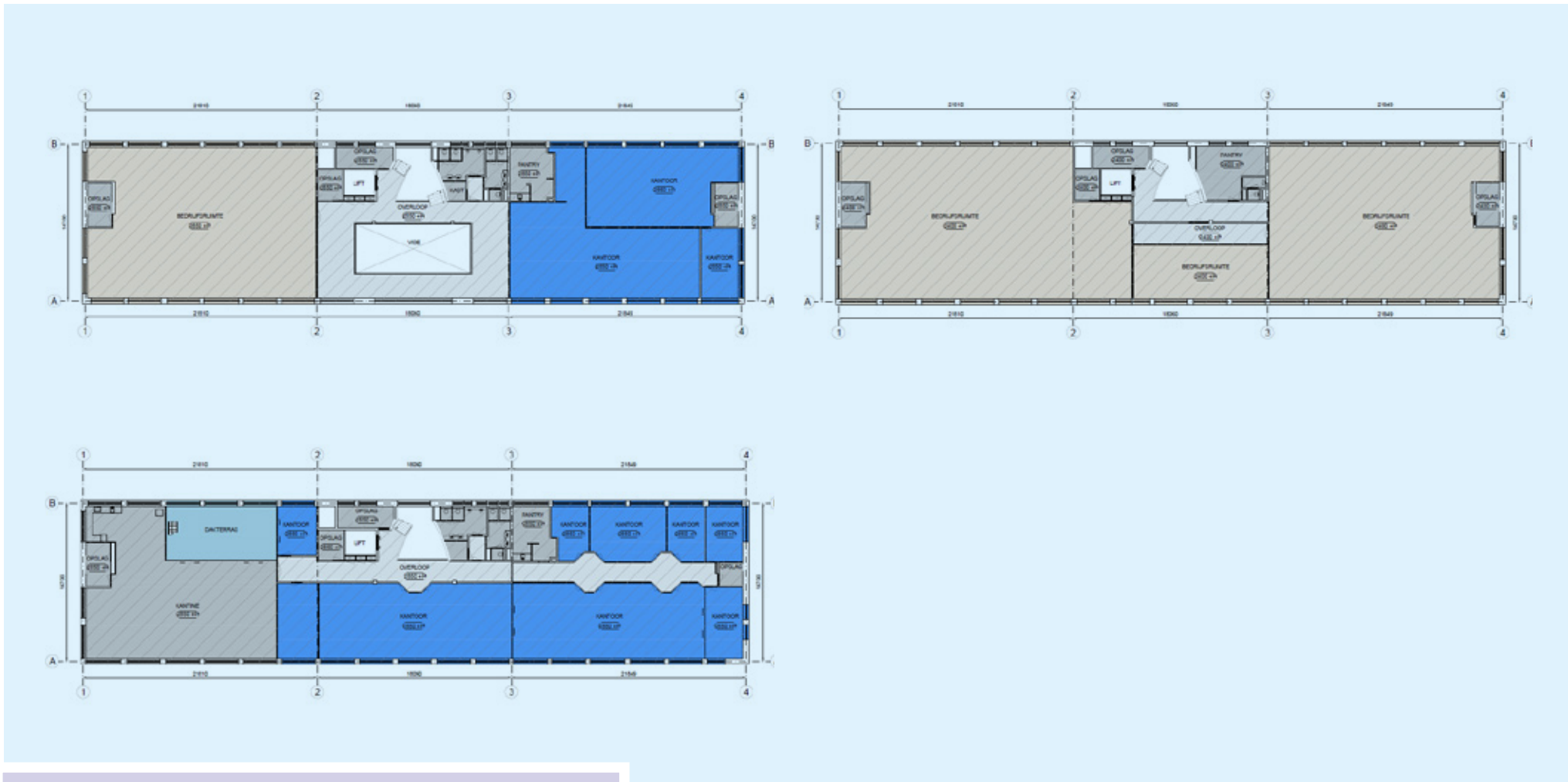
PLATTEGROND Eerste, tweede & derde verdieping