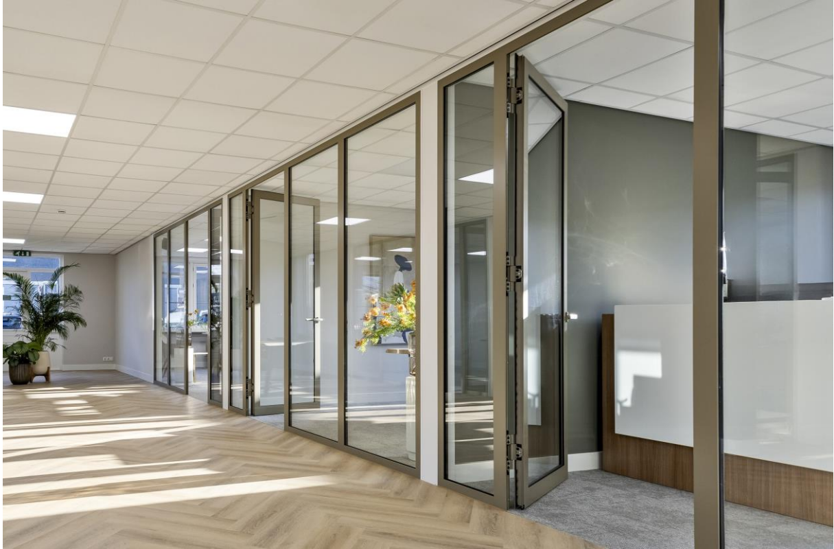
Optioneel andere indeling.