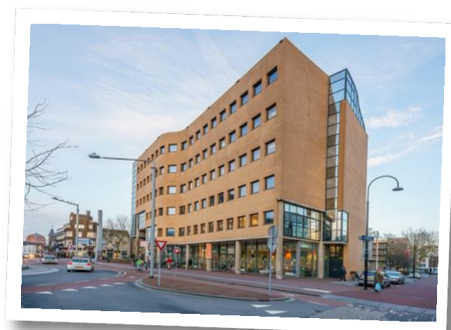
Johan de Wittstraat 40, 3311 KJ Dordrecht

Informatie aanvragen of bezichtiging plannen? Bel: 078 - 614 4 333