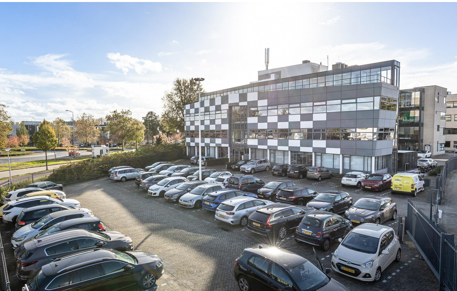
Meerenakkerplein 1-10 te Eindhoven