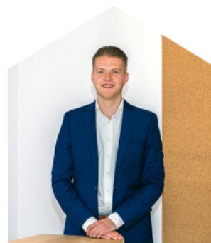
Sweder Boeve Makelaar KRMT