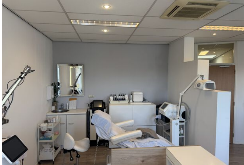
Kamer 112 1e verdieping