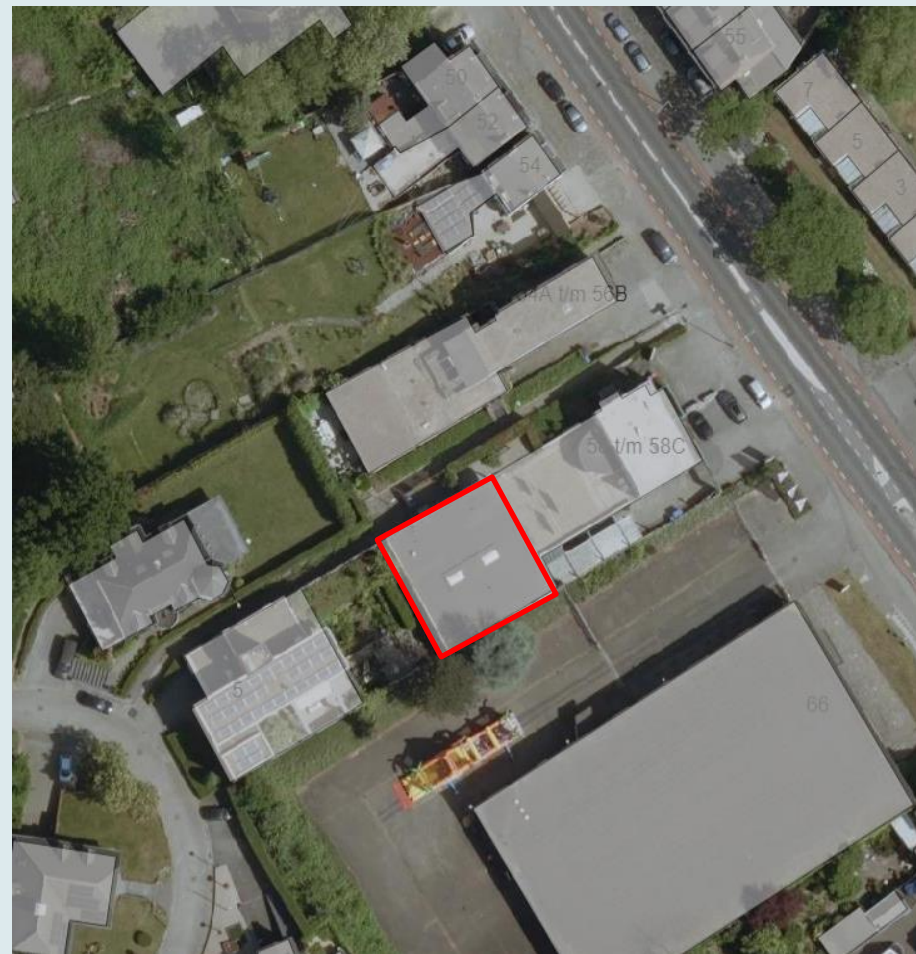
Heerlerbaan 58C, Heerlen