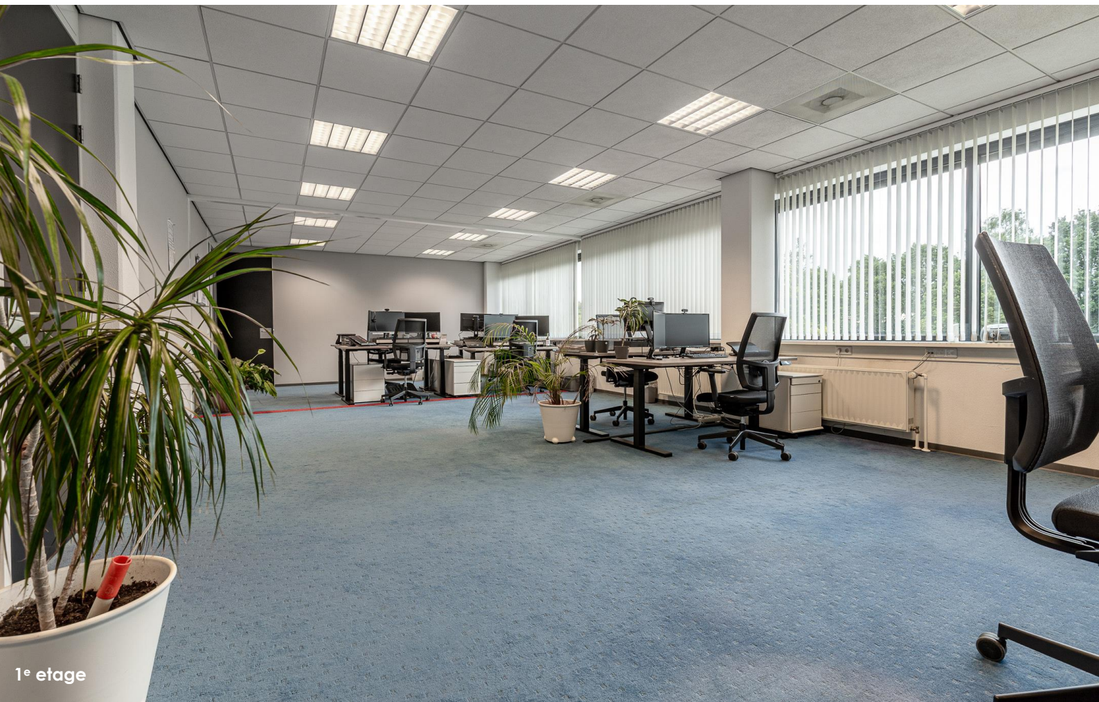
1 e etage