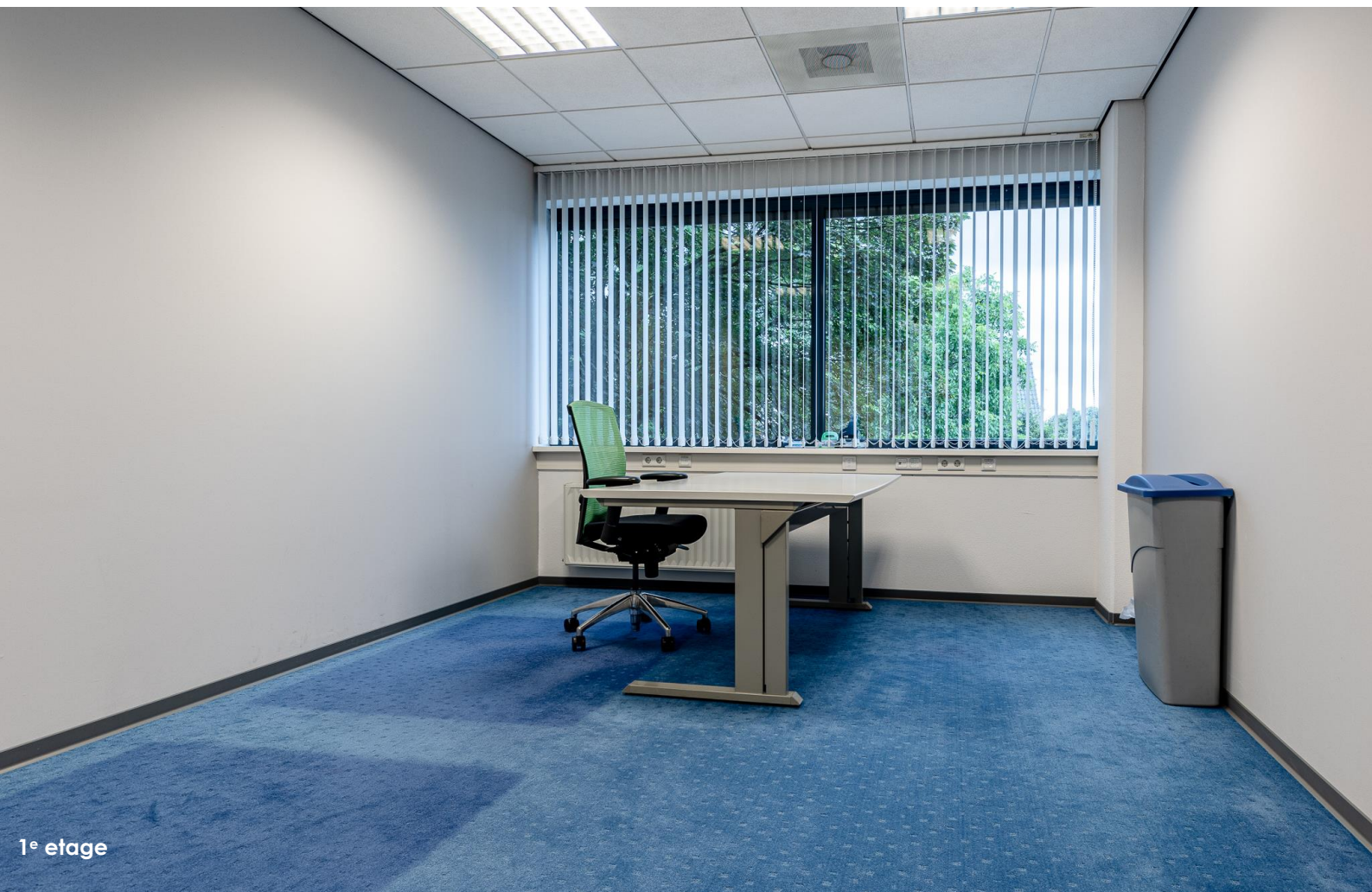
1 e etage