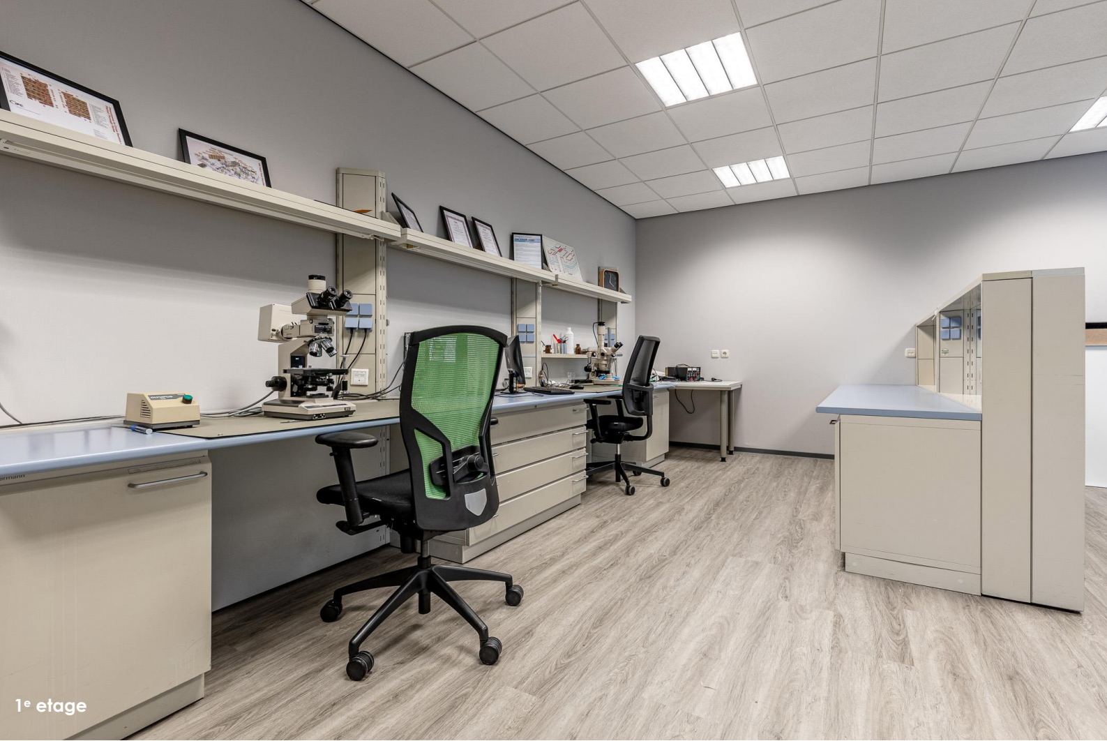
1 e etage