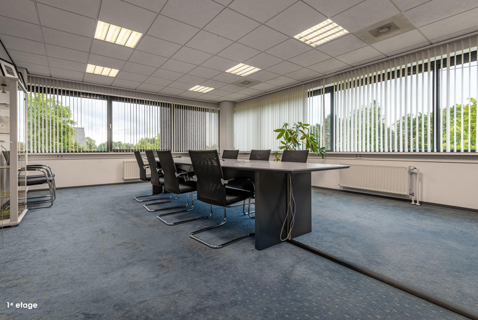
1 e etage