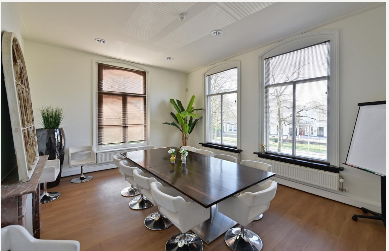
Gezamenlijke pantry en (flexibel te huren) vergaderruimtes!