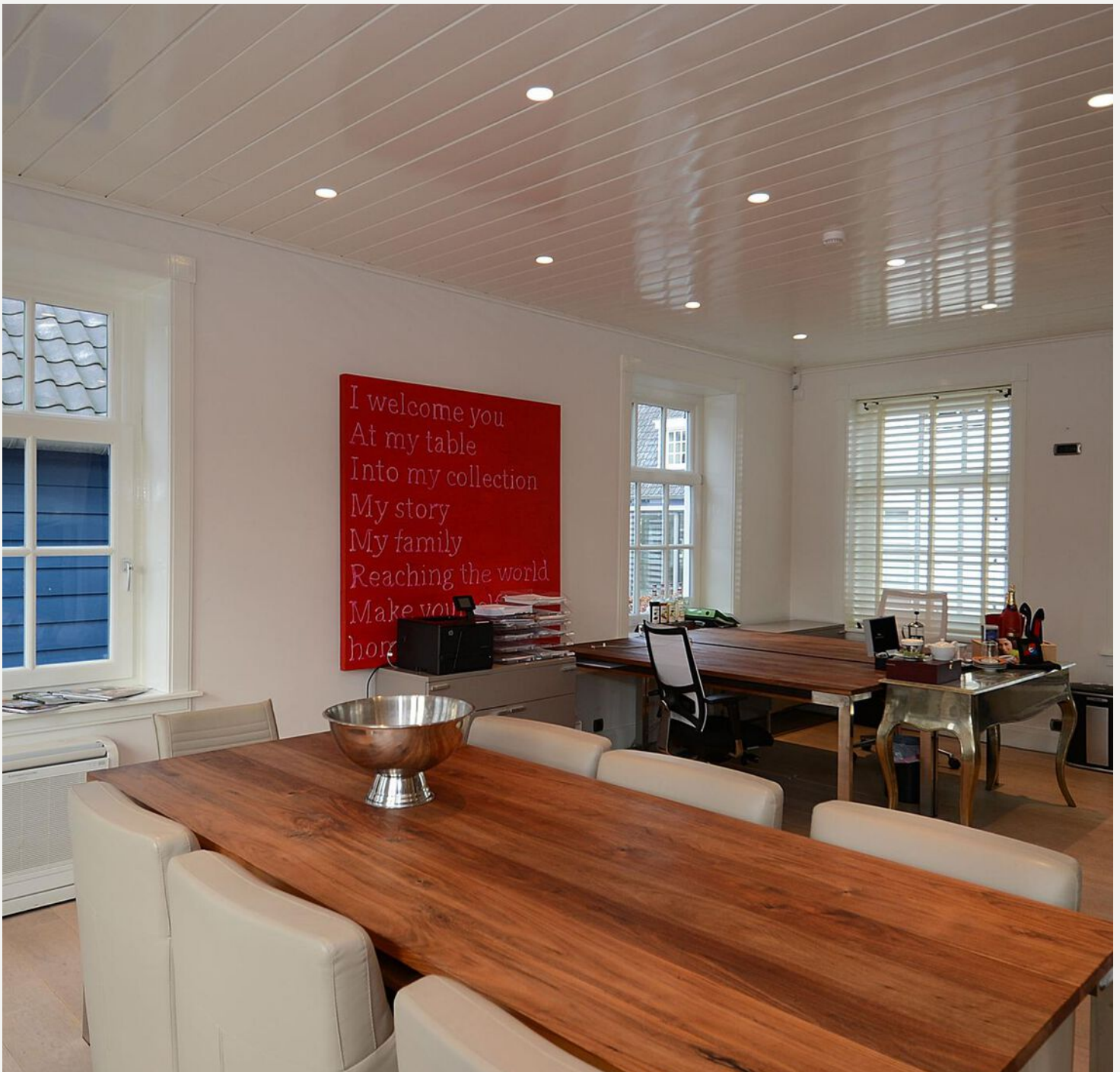
Kantoorruimte begane grond