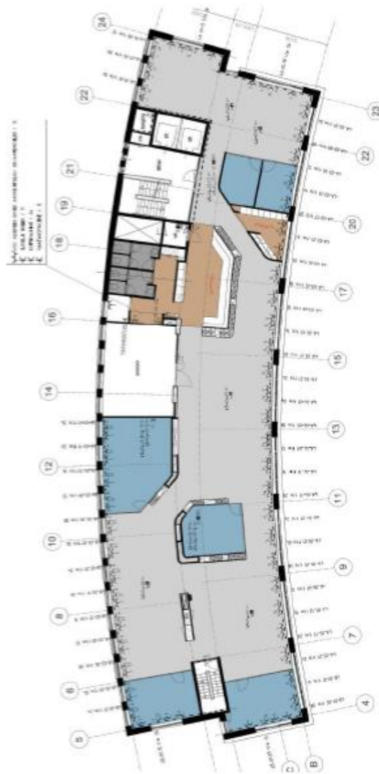
TAKENHOFFPLEIN 1 4 e VERDIEPING