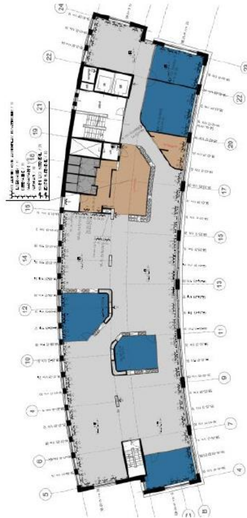
TAKENHOFPLEIN 1 5 e VERDIEPING