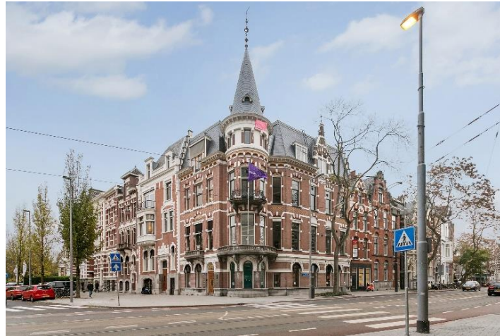
Schaub & Partners Bedrijfshuisvesting B.V. Westplein 5 C | 3016 BM Rotterdam

+31 (0)10 - 422 32 20 info@schaub.nl www.schaub.nl