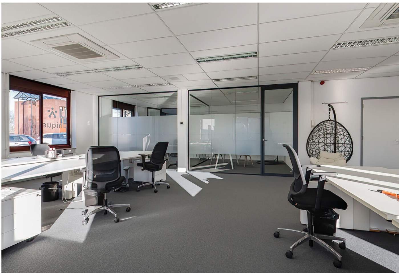
Kersenboogerd 3 -5, OB, Tiel