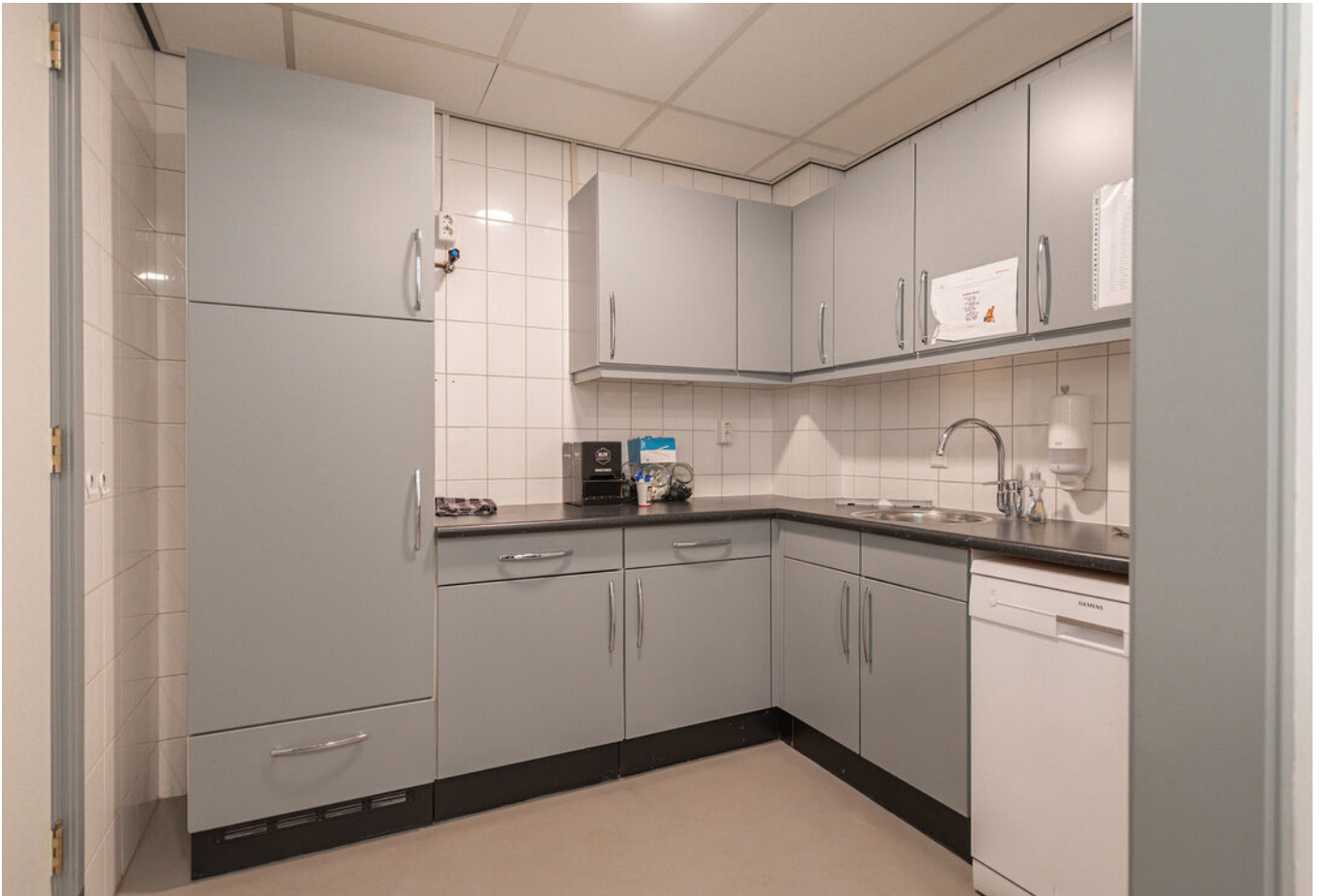
Kersenboogerd 3 -5, OB, Tiel