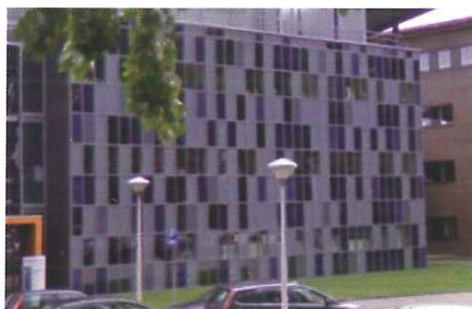
Variatie is het sleutelwoord: kleuren, textuur en materialen met een natuurlijke, eigen uitstraling.