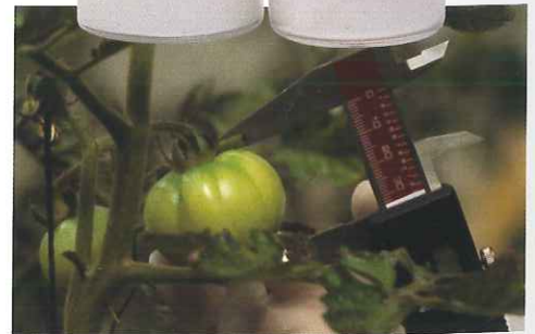
Sciences, food en health sterk vertegenwoordigd.