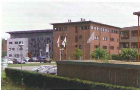
Toonbeeld van de huidige bebouwing langs het Nieuwe Kanaal: kroonlijsten aan het dakvlak, overstekten in entree's en speelse uitvoeringen in materialen.

Te denken valt aan gesinterde baksteen, kleureigen metalen, transparante gevels en ongeverfd hout. Op de grens van de groene boulevards, het levendige water rondom en de omringende woonbuurt, variëren de gebouwen in volume tot maximaal 4 tot 6 verdiepingen hoog en gaan zo op natuurlijke wijze op in de omgeving. Het mag duidelijk zijn dat dit bouwplan recht doet aan de omgeving én aan uw onderneming. Want alle gebouwen krijgen een eigen identiteit en uitstraling, maar behouden de eenheid in het totale gebied.