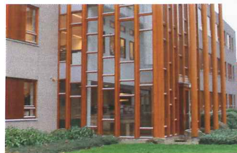
De stijkenmerken van de onderscheidende architectuur is een reflectie van de bebouwing uit de directe omgeving.