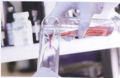
Onderdeel van het Wageningen Business en Science Park.