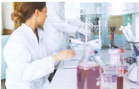
Wageningen toonaangevend op het gebied van Life Sciences.