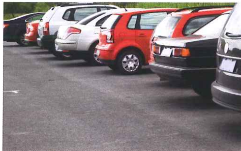
Perfekte bereikbaarheid en parkeerfaciliteiten.