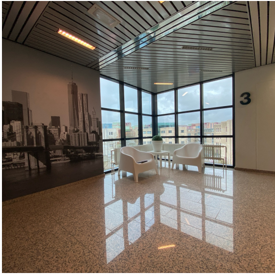
FERDINAND BOL | DOKTER VAN DEENWEG 74 – 82 | 8025 BM ZWOLLE

CENTRAAL GELEGEN OP KANTORENTERREIN OOSTERENK II