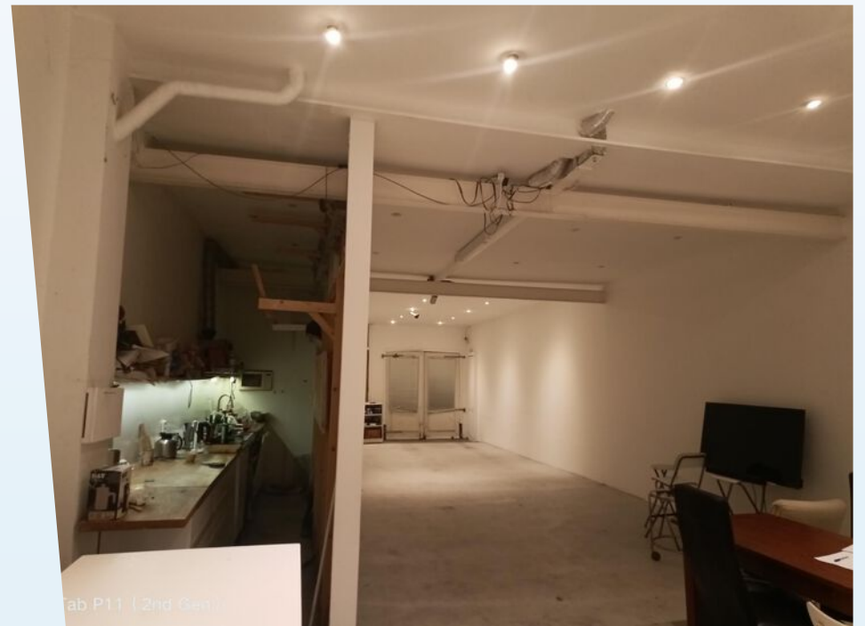
Tab P11 (2nd Gen)