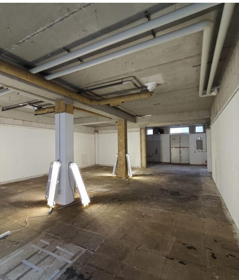
Van Coothplein 42 Huidige situatie