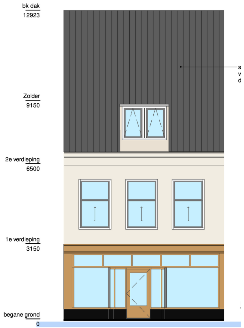
Voorgevel - nieuwe toestand