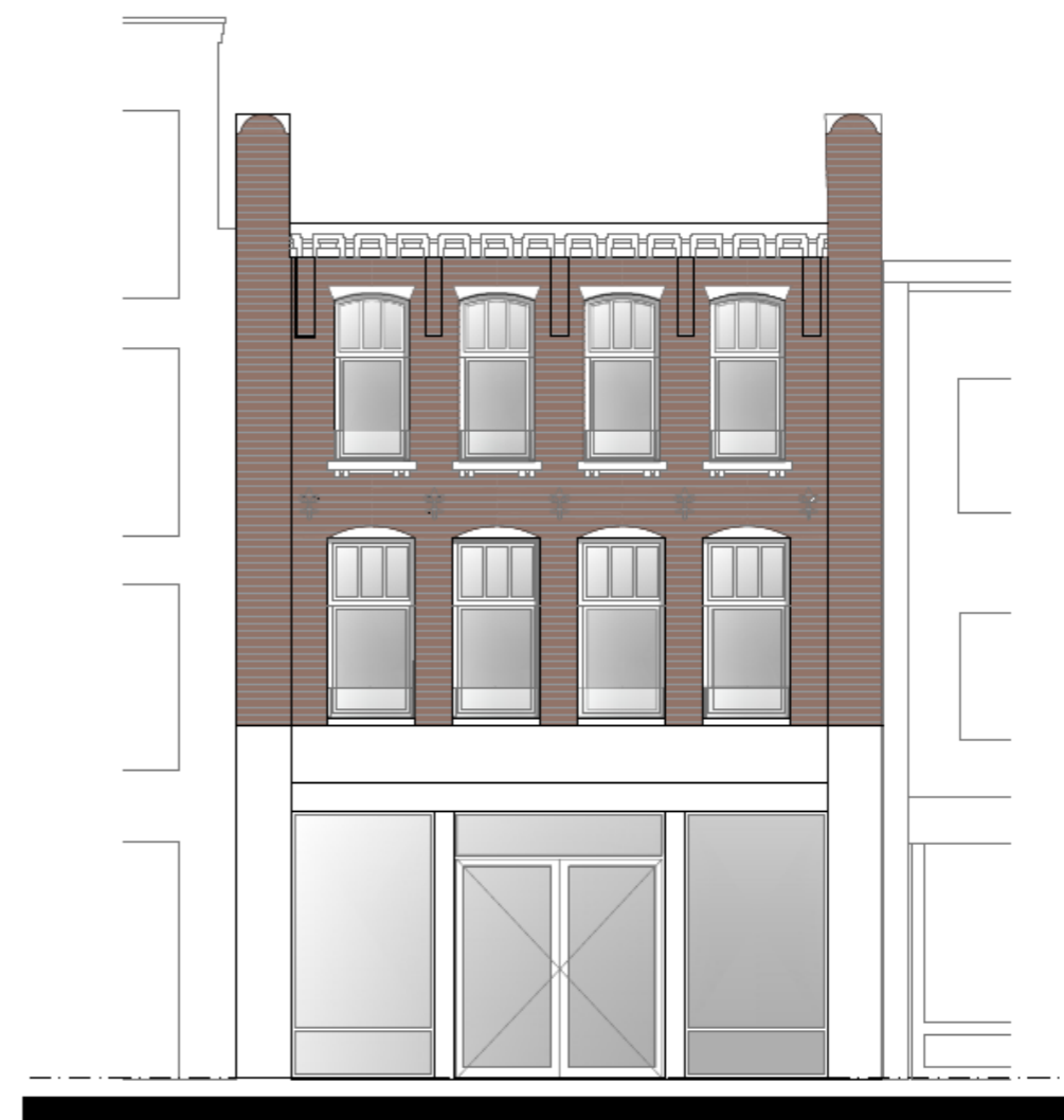
Voorgevel Nieuw (Vrijstraat)