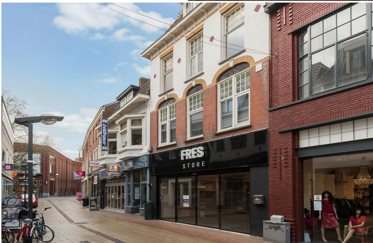
Haverstraatpassage 9 | Enschede