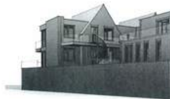
3D ACHTERZUDE 02

Objectinformatie: Raadhuisstraat 14, 7255 BM Hengelo (gld)