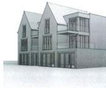
3D VOORZUDE 02