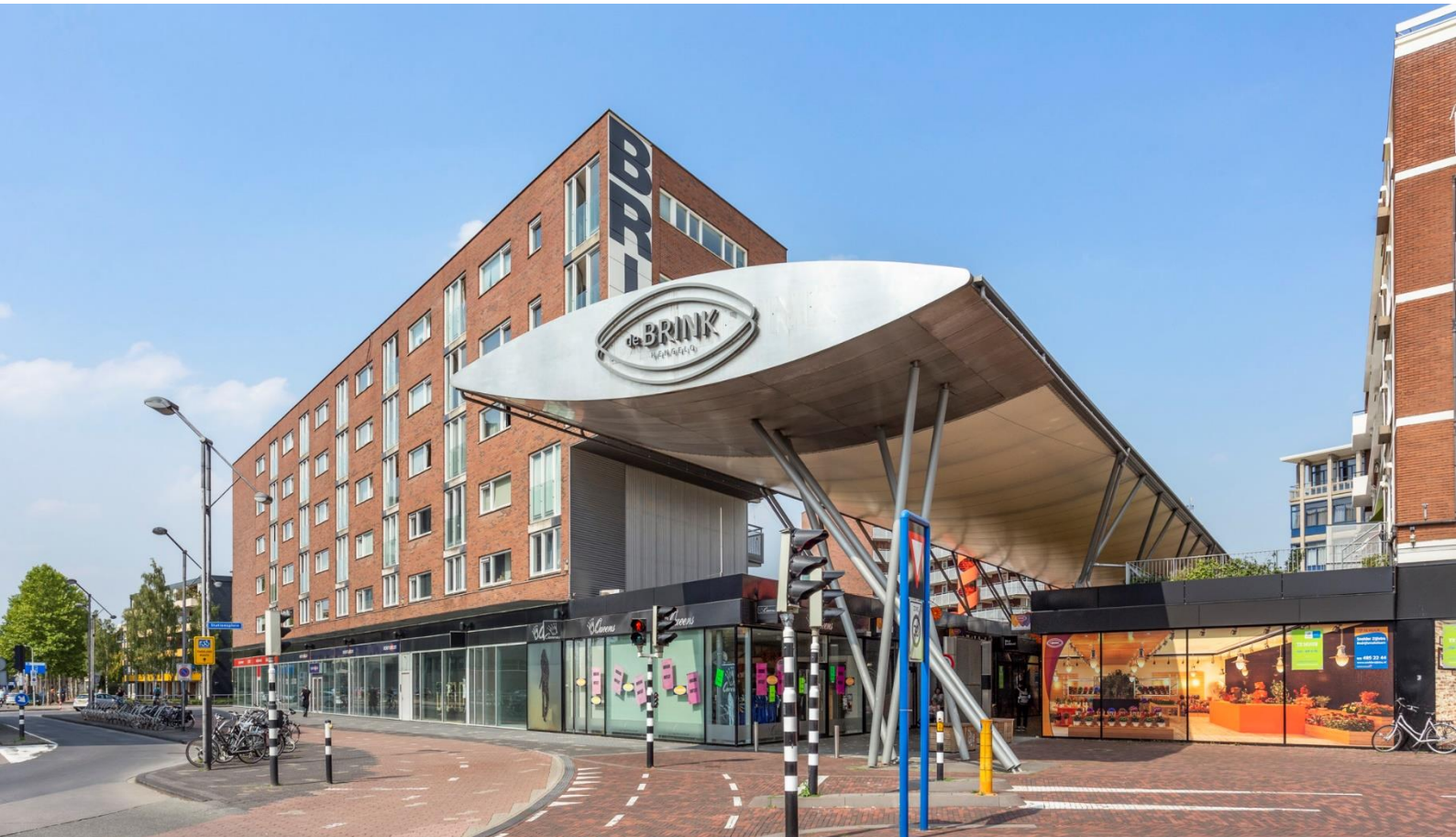
winkelcentrum "De Brink" | Hengelo