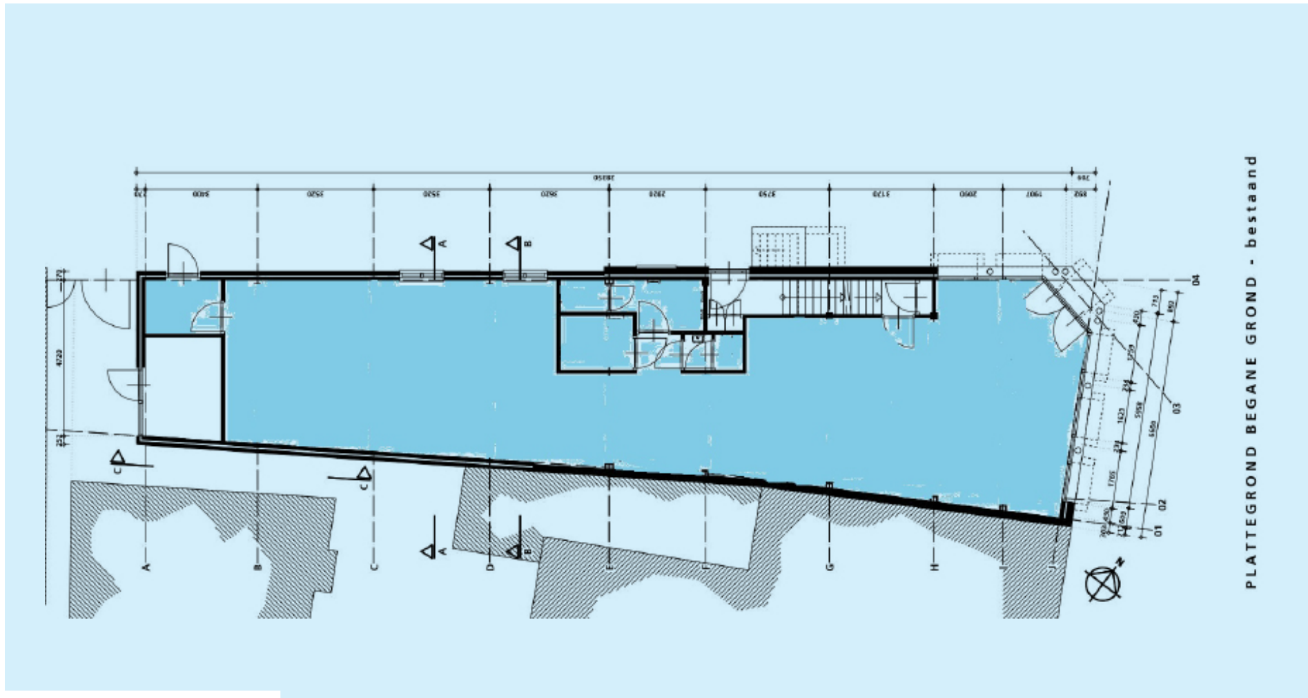
PLATTEGROND BEGANE GROND - bestand