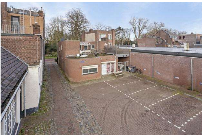
Optioneel parkeerplaatsen beschikbaar