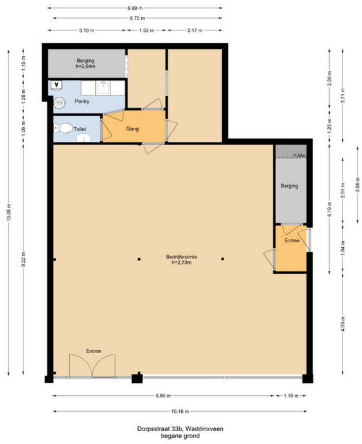
Dorpsstraat 33b, Waddinxveen begane grond